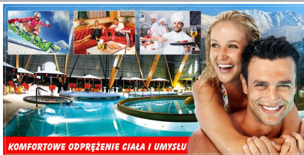
KOMFORTOWE ODPRĘŻENIE CIAŁA I UMYŚŁU

Wyżywienie „Klasy VIP”: 2x dziennie: śniadania oraz obiadokolacje w postaci „szwedzkich stołów” z daniami ciepłymi (mięsa, zupy, ryby..), zakąski, owoce sery, ciasta i desery.. (płatne tylko napoje przy obiadokolacji)