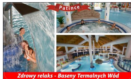
Zdrowy relaks - Baseny Termalnych Wód

2x dziennie w postaci śniadań oraz obiadokolacji w formie „szwedzkich stołów” Plus słodkie bufety oraz dni przysmaków kuchni Regionalnej (płatne tylko napoje przy obiadokolacji).