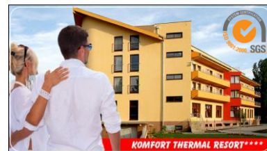
KOMFORT THERMAL RESORT****