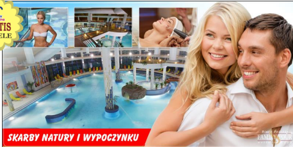
SKARBY NATURE I WYPOCZYNKU

PATINCE OAZA słynna są z ciepłego, słonecznego mikroklimatu i gorących źródeł. Tutejsze wody termalne gwarantują relaks, odprężenie oraz regenerację ciała i umysłu z korzyścią dla zdrowia. Czekają baseny termalne wyposażone w stanowiska masażu wodnych i perełkowych, bogaty świat saun (saunarium), fitness i wellness centrum, jacuzzi, słoneczne tarasy, plaża z leżakami oraz 'Bonusy' (cena zawiera) czynią nasz wypoczynek wSPAniałym i zdrowym!