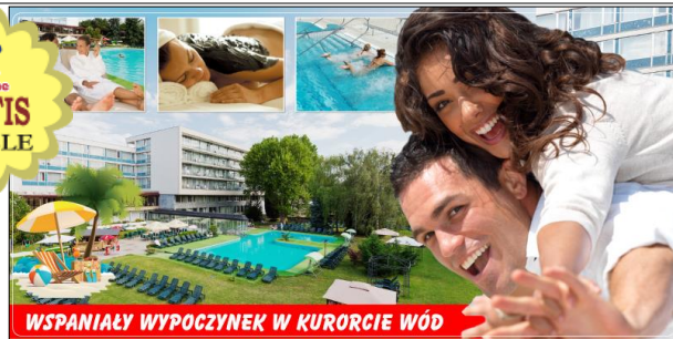
WSPANIAŁY WYPOCZYNEK W KURORCIE WÓD

Piestany: słynny renomowany kurort. Położony w dolinie Vagu, szeroko otwartej na południe, co zapewnia łagodny mikroklimat i duże nasłonecznienie. Własne gorące źródła dobroczynnych wód termalnych, siarkowe borowiny oraz bogata infrastruktura zapewniają wSPANIAŁY, zdrowy wypoczynek w przepięknych okolicznościach przyrody.