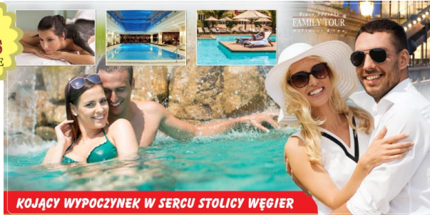
KOJĄCY WYPOCZYNEK W SERCU STOLICY WĘGIER

Budapeszt , należy do najpiękniejszych stolic Europy, mało jednak kto wie, iż w samym sercu miasta na środku Dunaju jest OAZA spokoju (naturalna wyspa na DUNAJU) nazywana wyspą św. Małgorzaty (Margitsziget). Znana z gorących źródeł, przy których powstał Kurort/Uzdrowisko do którego zapraszamy! By odkryć zdrowe właściwości wód termalnych, borowin i zabiegów w czasie wolnym poznając skarby i zabytki jednej z najpiękniejszych stolic Europy.