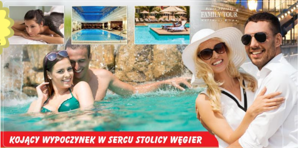
KOJĄCY WYPOCZYNEK W SERCU STOLICY WĘGIER