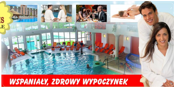
WSPANIAŁY, ZDROWY WYPOCZYNEK

2x dziennie: śniadania i obiadowe kolacje w formie bogatych szwedzkich stołów (dania regionalne i europejskie, nie zawiera napoi przy obiadowych kolacjach, w południe węgierska zupa GRATIS)