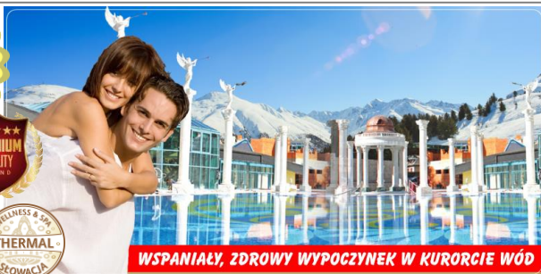
WSPANIAŁY, ZDROWY WYPOCZYNEK W KURORCIE WÓD

Rajeckie Teplice – nazywane za sprawą miejscowych gorących źródeł oraz zlokalizowanego przy nich kompleksu termalnego „AFRODYTY” uzdrowiskiem tej greckiej bogini piękna i wiecznej młodości. Malownicza lokalizacja w kotlinie górskiej na łagodnym styku „Małej Fatry” oraz dolomitowych skał wapiennych „Stiażovskich Vychov” zapewnia mnóstwo możliwości aktywnego wypoczynku w czystym mikroklimacie!