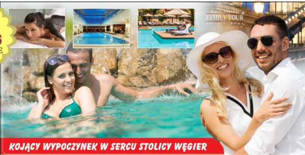
KOJĄCY WYPOCZYNEK W SERCU STOLICY WĘGIER

Budapeszt , należy do najpiękniejszych stolic Europy, mało jednak kto wie, iż w samym sercu miasta na środku Dunaju jest wyspa nazywana wyspą św. Małgorzaty (Margitsziget). Znajduje się tutaj renomowane uzdrowisko szczytujące się wielowiekową tradycją wykorzystania wód termalnych i borowin oraz kąpeli z korzyścią dla zdrowia. Spędzimy wSPAniały urlop z korzyścią dla zdrowia w malowniczej aurze!