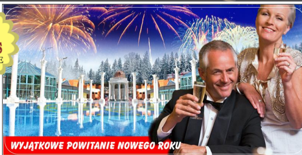
WYJĄTKOWE POWITANIE NOWEGO ROKU

Covid19 Kurort AFRODYTA służy poprawie zdrowia (zgodnie z prawem) jest otwarty i działa normalnie hotel, wyżywienie, zabiegi, baseny termalne, etc. Przed przyjazdem test RT-PCR.