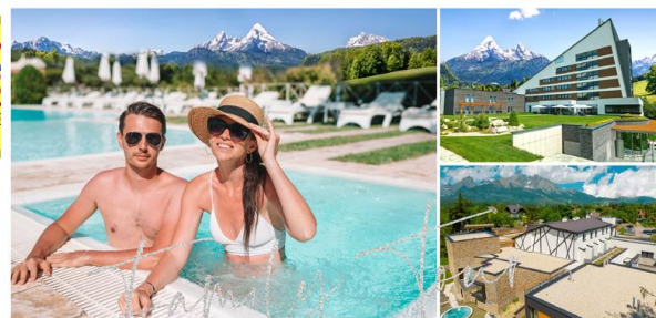
WELLNESS WAKACJE W GÓRACH

Majestatyczne TATRY na wyciągnięcie ręki, Wellness atrakcje na miejscu! Odpężenie ciała i umysłu górskim mikroklimatem oraz malowniczymi widokami „honornych” szczytów. Doskonałe dla aktywnej turystyki. Elitarny wypoczynek w OAZIE Wellness & SPA z basenami i saunami z dala od tłumów - blisko gór i atrakcji.