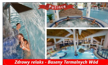
Zdrowy relaks - Baseny Termalnych Wód

2x dziennie w postaci śniadań oraz obiadokolacji w formie „szwedzkich stołów” Plus słodkie bufety oraz dni przysmaków kuchni Regionalnej (płatne tylko napoje przy obiadokolacji).