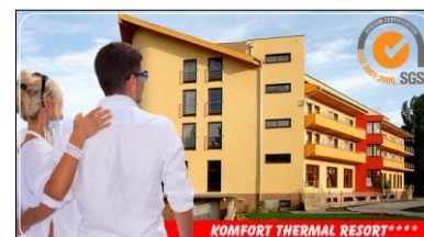
KOMFORT THERMAL RESORT****