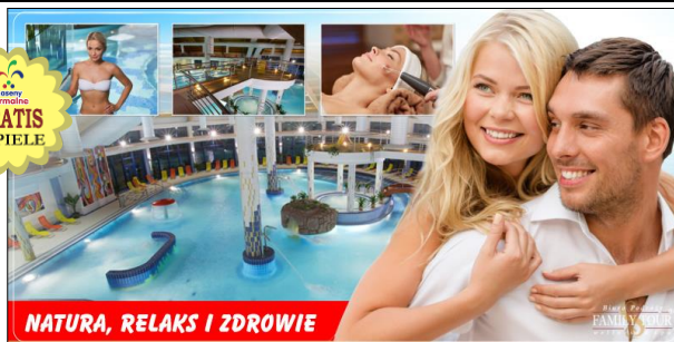
NATURA, RELAKS I ZDROWIE

PATINCE – urokliwa Oaza na południu Słowacji. Słynna z największej w kraju liczby słonecznych dni oraz dobroczynnych wód termalnych w czystej Naturze. Pakiet zapewnia wSPAniały komfortowy wypoczynek z korzyścią dla zdrowia! Korzystanie z basenów termalnych, świata saun (saunarium), jacuzzi, leżaki. Skorzystamy także z masaży i zabiegów Health/Beauty w nowoczesnej akademii SPA.