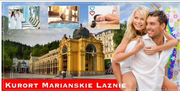
KURORT MARIANSKIE LAZNE

• Wyżywienie „Klasy VIP” : 2x dziennie: śniadania oraz obiadokolacje w formie szwedzkich stołów, dania ciepłe (mięsa, zupy, ryby), zakąski, owoce sery, ciasta i desery. (Płatne tylko napoje).